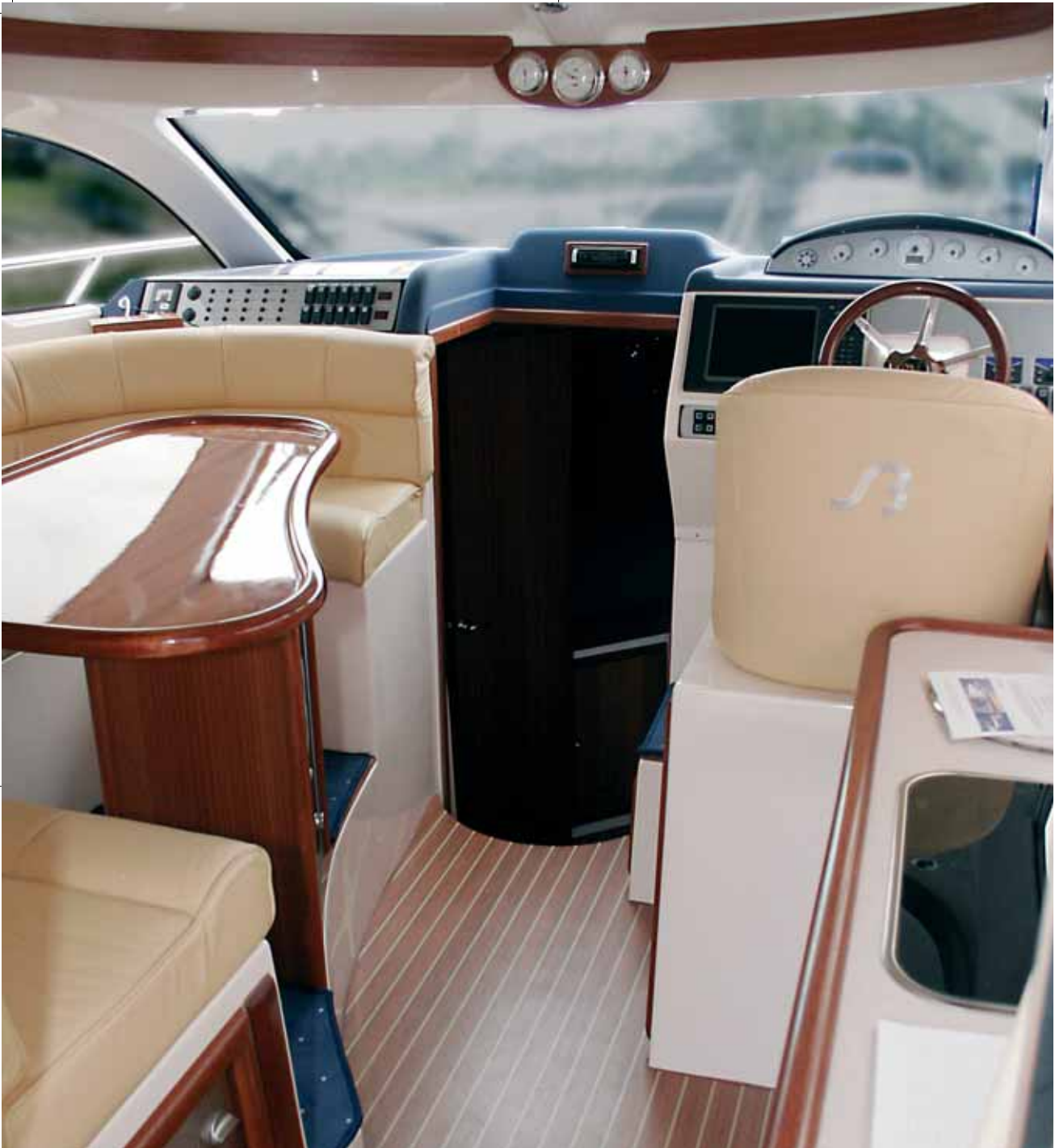
Der Salon ist hell und mit großen Fenstern versehen. Tisch, Sofa, Innensteuerstand und Pantry sind hier untergebracht.