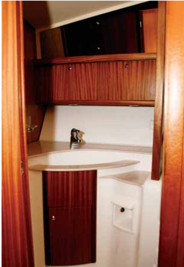
Die Nasszelle befindet sich unter dem Innensteuerstand und enthält ein WC, eine Dusche und ein Waschbecken.