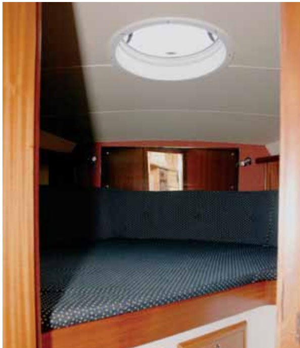
Die geräumige Doppelkoje im Vorschiff ist diagonal eingebaut. Unter der Koje ist viel Stauraum untergebracht.