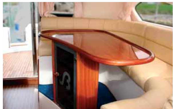
In der Konsole des Salontisches ist die Bordbar integriert. Das Sofa bietet Platz für sechs Personen.

Das Boot ist nach Kategorie „B“ CE-zertifiziert. Der Rumpf besteht teilweise aus Sandwichlaminat mit einem Schaumkern aus Divinacell. Die Badeplattform ist in die Schale integriert und mit einer ausklappbaren Badeleiter versehen. Der Gerätebühgel über der Flybridge bietet Platz für Radar, Antennen, Beleuchtung und andere Gerätschaften. Die Skorgenes hat neben dem fest angeschlagenen Buganker, in skandinavischer Manier auch einen Heckanker, der in die Badeplattform eingelassen ist. Das ist ein wichtiges Ausrüstungsdetail in den nordischen Schären, weil dort vorwiegend vor Heckanker angelegt wird. Die Ankerwinde sitzt unter Deck im Motorraum.