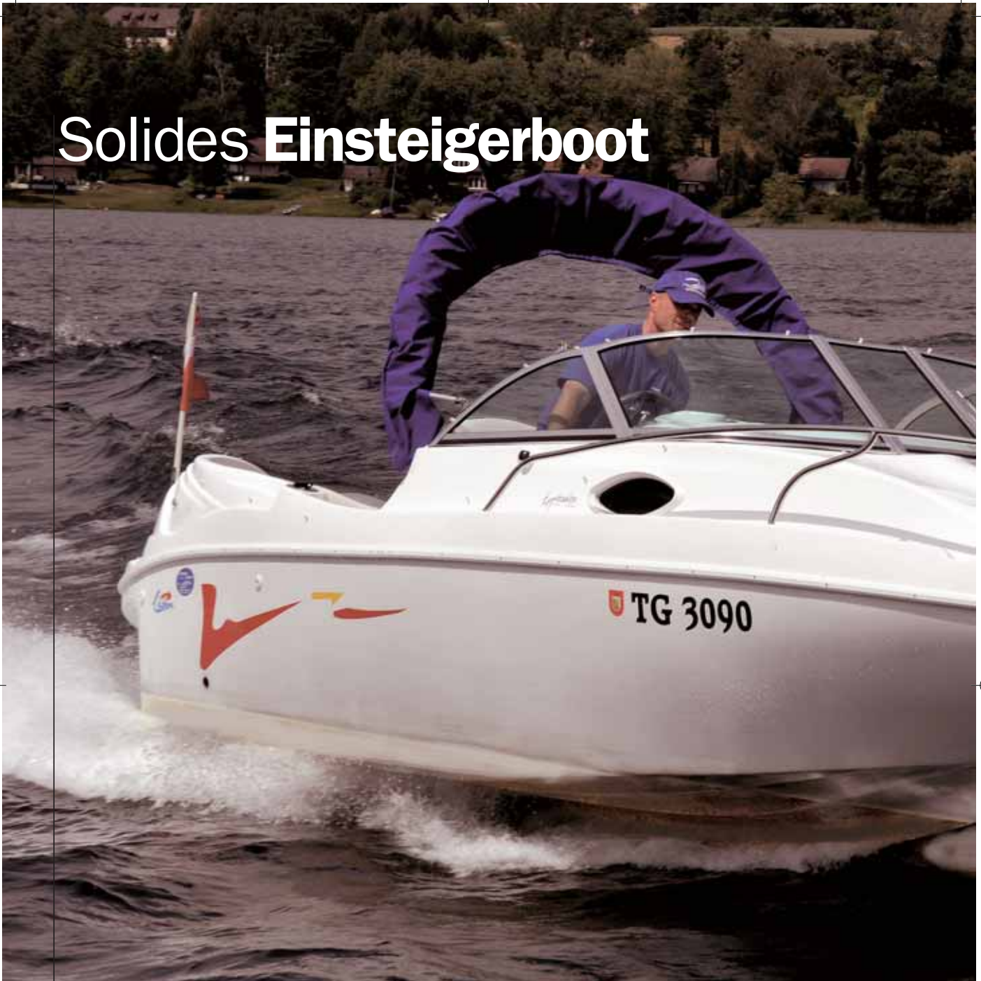
Gute Fahreigenschaften: die Lema Expression.