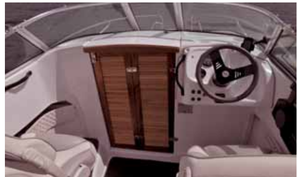
Zugang zum Salon und Fahrerstand.