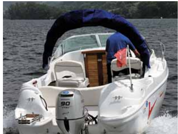
Das Cockpit ist groß, die Motorisierung mit 90 PS ist ideal.