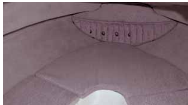
Eine kleine Schlupfkabine.

man sich vor einem Schauer oder zum Mittagsschlaf zurückziehen. Zum Übernachten ist es etwas eng. Verschluss wird die Kabine mit einer schweren Holz- tür, dem einzigen Holzteil an Bord. Ein kleiner Stauraum liegt unter dem Polster im Spitz.