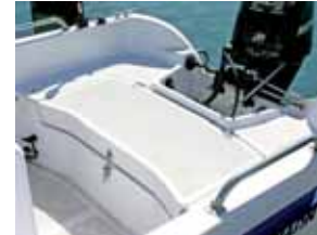
Sitzfläche hinter dem Steuerstand achtern, darunter Stauraum.