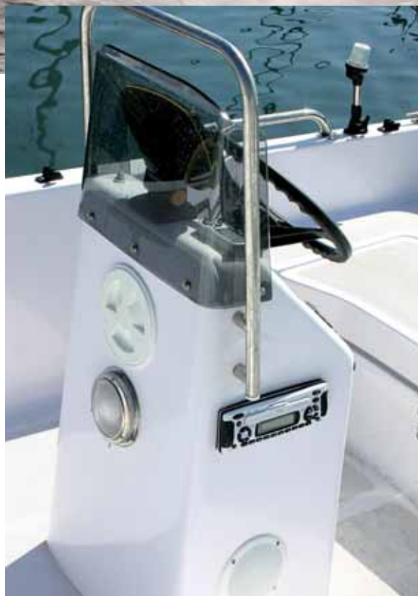
Steuerstandkonsole mit Radio und Lautsprecher.

Die Gleitphase kann noch gehalten werden bei 2800 U/min. 20,2 km/h lesen wir vom GPS ab. Um diesen Zustand aus ruhender Position zu erreichen, benötigen wir gerade mal drei bis vier Sekunden. Das klappt am besten mit einem Kavaliertart. Die Maschine dicht an den Spiegel getrimmt, Hebel auf voll voraus und dann gefühlvoll wieder runter mit dem Gas. Wem das nicht fetzig genug ist, der lässt die Schaltkrücke halt einfach ganz vorne stehen. So zwischen 12 und 14 Sekunden muss man sich dann gedulden, bis die Höchstgeschwindigkeit erreicht ist. Dabei ist allerdings ein gefühlvoller rechter Daumen erforderlich, der per Wipptaste nach dem günstigsten Trimmwinkel des Mercury sucht. Doch das hat man schnell raus.