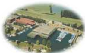
Zweigbetrieb Seedamm-Marina Pfäffikon/SZ