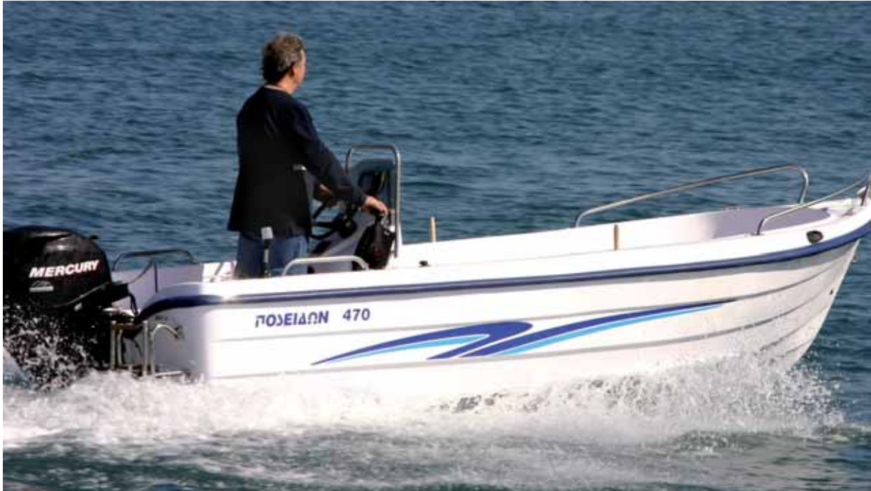
Nicht nur schnell, sondern auch sehr sicher.

dieser Geschwindigkeit, in Relation zur Bootsgröße, etwas vorsichtig zu Werke gehen. Das ist auch gut so. Aber hat man erst einmal den Bogen raus und erkennt, was diesem Rumpf zuzutrauen ist, dann gibt es kein Halten mehr, das 470 macht alles mit. Weich und satt ist das Einsetzen nach dem Sprung, dank Doppelschale und Ausschäumung. Sauber drückt der Rumpf das Wasser zur Seite, nicht ein Tropfen Gischt kommt über. Festen Halt sollte man sich bei solcher Art Manöver auf