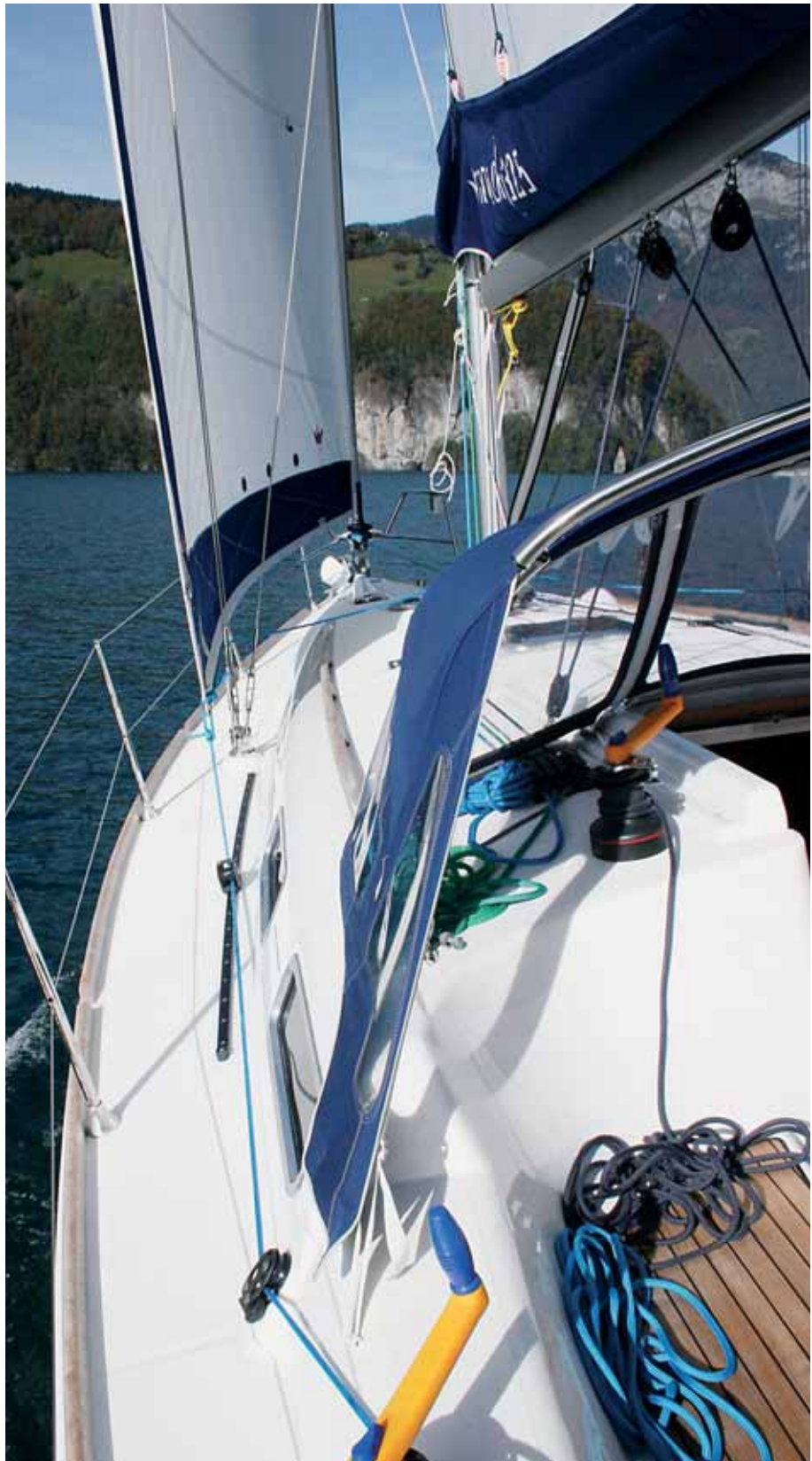
Das Deckslayout ist übersichtlich, aber ausreichend ausgestattet. Unter der Sprayhood ist genügend Platz, um die Fallwischen zu bedienen.

Wer diese Art von Boot mag, macht mit der neuen Dufour nichts verkehrt. Trotz der vergleichsweise wenig effektiven Taklung, haben wir auf unserem Probeschlag im Urner Becken nichts vermisst. Allerdings ist dieser Teil des Vierwaldstätter Sees mit ordentlichem Wind gesegnet, sobald die Sonne rauskommt. Leider ist das am Bodensee etwas anders. Eine, vor allem bei Leichtwind etwas effektivere Besegelung wäre des-