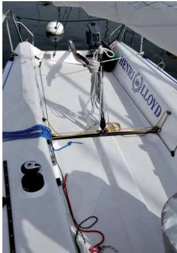
Das einfach aber funktionell und hochwertig ausgestattete Cockpit besticht vor allem durch Geräumigkeit.

Das Rigg aus Aluminium ist mit zwei gepfeilten Salingpaaren ausgerüstet und