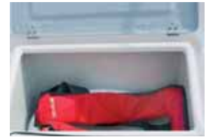
Gut konstruierte Backskisten, etwas lasche Scharnierbefestigung.

PS-Motorisierung an. Der Motor stammt im Angebotspaket üblicherweise von Selva Marine. Jede Motorisierung anderer Hersteller ist auf Kundenwunsch im Rahmen des Erlaubten ebenfalls möglich. Die Fahrleis-