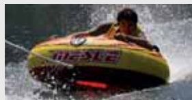
Bei Mesle kann man Tubes testen.

oder für Testzwecke ausleihen. Infos: Mesle Sports, Schulstr. 8–10, D-78589 Dürbheim, Tel. +49 (0) 74 24 / 30 10 oder E-Mail: info@mesle.de