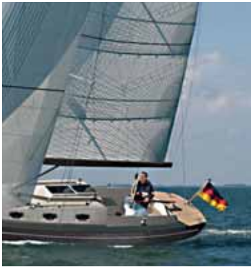
seiner Leertonne mit einem Gewicht von 2600 kg ist die Clarc 33 trailerbar.

Segler mit tiefen Plätzen können mit einem Festkiel