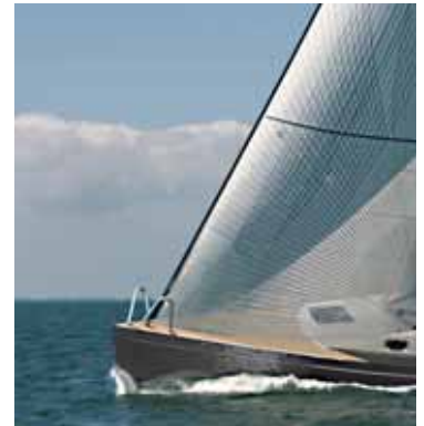
Mit einer Breite von 2,54 m und einem Ge wicl

der Standardausführung ohne Ausnahmegenehmigung trailerbar. Gleichzeitig bietet der gestreckte Rumpf aber fünf gut dimensionierte Kojen, knappe Stehhöhe, ein abtrennbares Vorschiff, zwei Ausbauversionen mit WC und sogar Stauraum für nor-