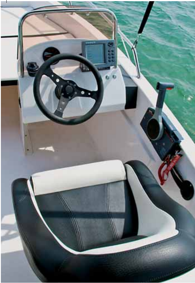
Bequemer Sitz und zweckmäßig ausgestatteter Fahrerstand.

Steuerkonsole (mit Motoreninstrumentierung, Kompass und ein paar Schaltern ausgestattet) leicht geschützt. Die gleiche Konsole gibt es ohne Technik für den Beifahrer, war bei unserem Testboot aber nicht montiert.