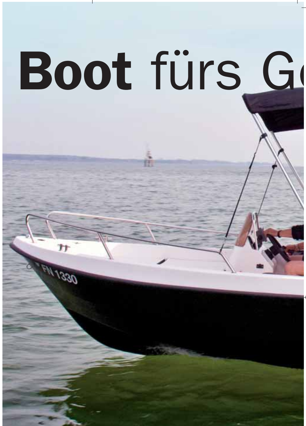
MM 515 Duo: Solide verarbeitet, gute Fahreigenschaften und günstiger Preis.

Allein die MM 515 wird mit unterschiedlichen Decklayouts neben dem hier vorgestellten Modell Duo noch als Allround, Holliday und Classic angeboten. Die Bauqualität der von der Redaktion unter die Lupe genommenen MM 515 Duo ist sehr