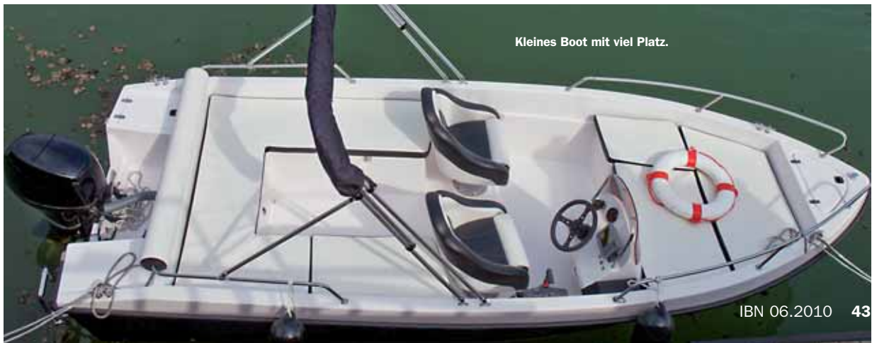
Kleines Boot mit viel Platz.