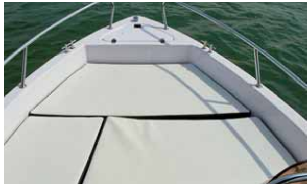
Ein Keil (steuerbords) macht aus der Sitz- eine Liegefläche.

Motorisieren kann man die MM 515 mit einem Außenborder zwischen 30 und 50 PS. Dreißig PS sind eher zu wenig. Am Spiegel unseres Testboots hängen 40 PS. Das ist ausreichend, wenn man meist nur zu zweit und mit wenig Ausrüstung unterwegs ist. Für etwas mehr Fahrspaß bietet sich die 50-