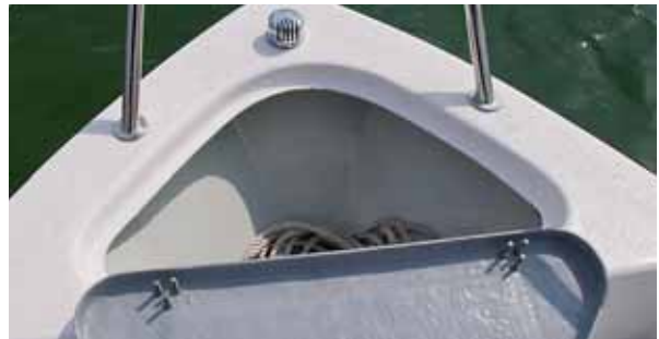
Ankerkasten, LED-Buglicht und solide befestigte Beschläge.