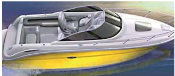
Searay 235 Weekend.

Infos: Nasbo-Werft, CH-8595 Altnau, Telefon +41 (0) 71 / 6 95 11 65, www.nasbo.ch