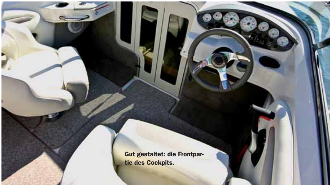
Gut gestaltet: die Frontpartie des Cockpits.