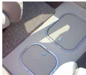
Zwei praktische Staufächer im Cockpitboden.

Frontsitzen im Schalenformat. Achtern ist eine breite Querbank, darunter Stauraum, der sich auch unter dem Cockpitboden findet, so der ausknöpfbare Teppichboden zur Seite gerollt wird.