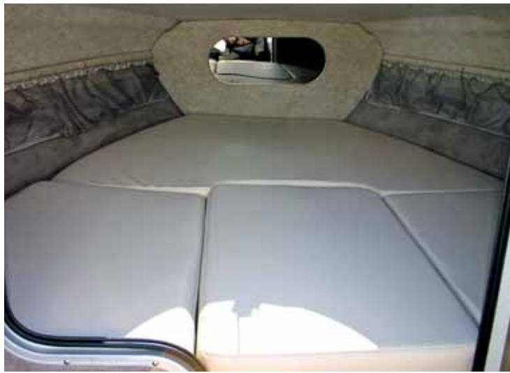
Die Werft hat in dem kompakten Boot eine brauchbare Kabine eingebaut.

Das Cockpit ist in dieser Version für fünf bis sechs Personen ausgelegt, mit zwei dreh- und verstellbaren