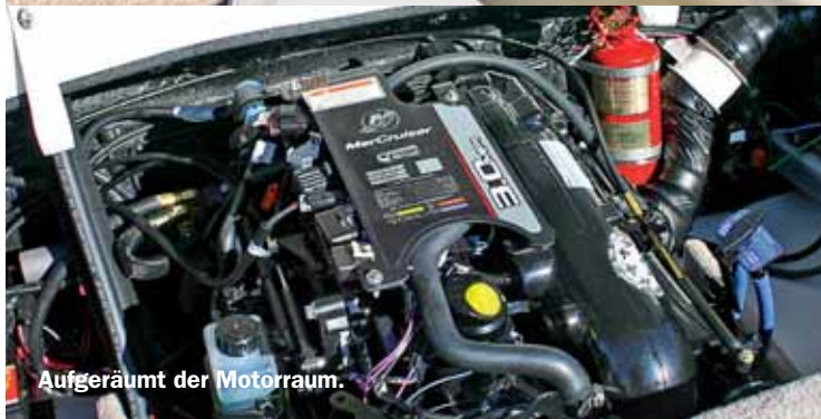
Aufgeräumt der Motorraum.

noch so mit 24,7 km/h (13,3 kn) diese Fahrstufe zu halten. Fairerweise darf hier auch nicht unter den Tisch fallen, dass das Testboot nicht urlaubsmäßig bestückt war und sich die Testcrew aus lediglich zwei Personen rekrutierte. Bei voller Beladung werden wohl zwei- bis dreihundert Umdrehungen draufgepackt werden müssen. Als zügige